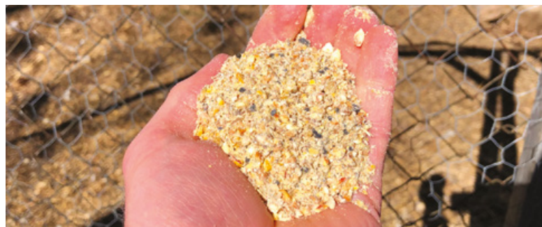
Moulée sous forme de grains concassés

Outre cette nourriture de base, on doit offrir aux poules l'accès au sol pour qu'elles puissent trouver elles-mêmes diverses sources de nourriture (graines, insectes, vers, racines, etc.). De plus, il est certainement intéressant de leur offrir des restants de table, puisqu'elles sont omnivores, elles sont capables de gérer les végétaux et la viande en les transformant en œufs et en fertilité... pas mal, n'est-ce pas ?