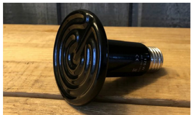
Ampoule chauffante en céramique