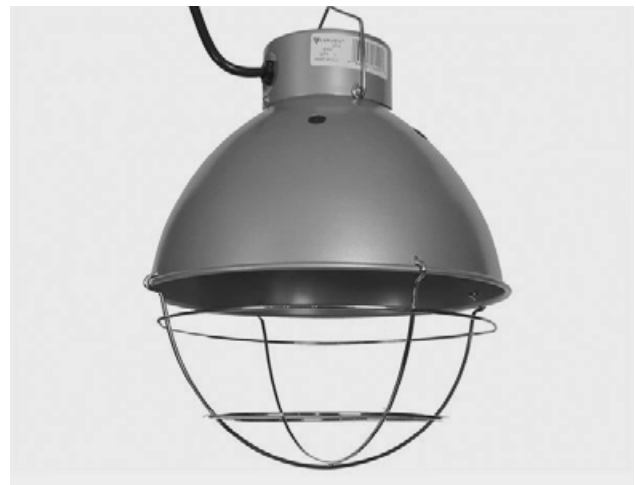
Abat-jour contenant une douille

S'il devient nécessaire de chauffer le poulailler, il existe différents appareils 8 . Le plus simple équipement consiste en un abat-jour contenant une douille conçue pour y visser une ampoule chauffante en céramique. 9 Idéalement, l'ampoule doit être localisée à 60 cm au-dessus du perchoir et dirigée vers ce dernier, afin que les poules puissent profiter du rayonnement de chaleur .